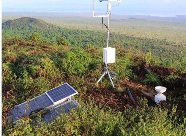
Imagen 2. Foto de estaciones instaladas

Fuente: Dirección del Parque Nacional Galápagos Elaborado: Dirección del Parque Nacional Galápagos