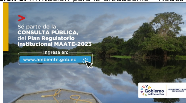
Ilustración 3. Invitación para la Ciudadanía – Redes Sociales

Medios de difusión: La difusión de la invitación se realizó mediante redes sociales (twitter y linkedin).