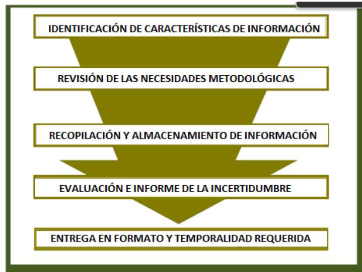
Figura 2. Procedimiento metodológico de registro y entrega de datos e información

A continuación, la Figura 2 muestra de manera general el procedimiento metodológico que guiará a las instituciones competentes en las fases de recopilación y entrega de datos e información según las necesidades y requerimientos de las Directrices del IPCC 2006, aplicadas por el país para el cálculo de los Inventarios Nacionales de GEI.