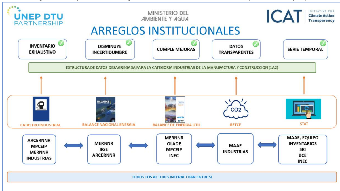
Figura 4. Propuesta de Arreglos Institucionales en base a los objetivos de la propuesta.

Los acuerdos propuestos en la presente Guía toman en consideración los cambios institucionales que han sufrido organismos sectoriales energéticos y además los roles y responsabilidades de cada actor (Tabla 14)