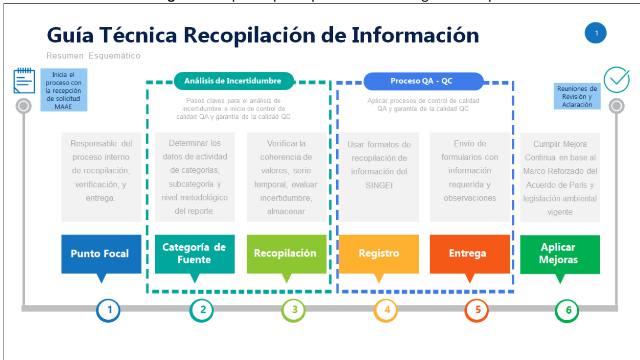
Figura 5. Esquema para aplicar la metodología de recopilación.

El siguiente esquema, recoge el proceso indicado en la presente guía, con la finalidad de que las organizaciones proveedoras de información puedan aplicarlo internamente para la recopilación y entrega de los datos que el país requiere para calcular y reportar los Inventarios Nacionales de Gases de Efecto Invernadero. La figura a continuación representa un resumen metodológico para el cumplimiento de lo establecido en las Directrices IPCC 2006, aplicadas por el MAAE.