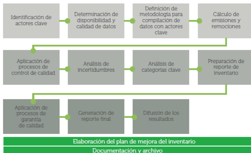
Figura 1. Proceso de elaboración de Inventarios Nacionales de GEI