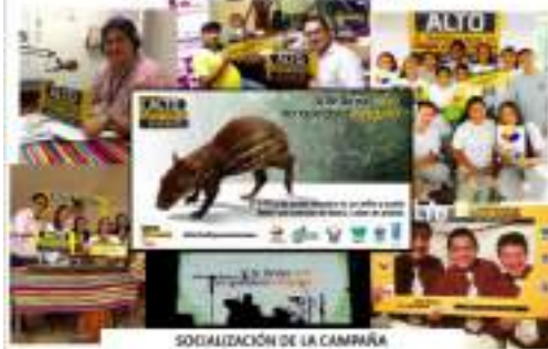
SOCIALIZACIÓN DE LA CAMPAÑA

Se realizó la Campaña ALTO EL TRÁFICO ILEGAL DE ANIMALES SILVESTRES ES UN DELITO. Si se lleva uno no quedará ninguno.