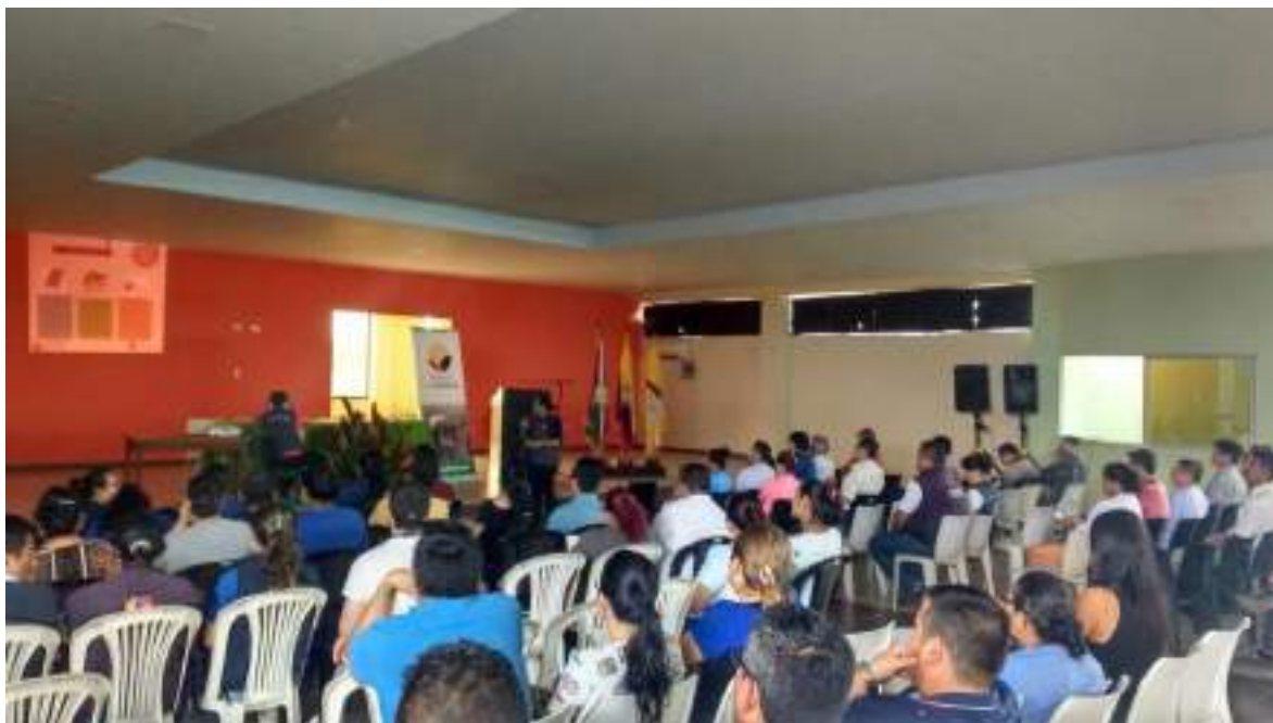
Fotografía N°. 3 Charla a agricultores sobre el Uso y Manejo Responsable de plaguicidas.

Se realizaron 4 Charlas los agricultores de las distintas parroquias, referente al Uso Responsable y Manejo de Plaguicidas. (En conjunto con MSP y AGROCALIDAD), en donde se capacitó a aproximadamente 90 personas.