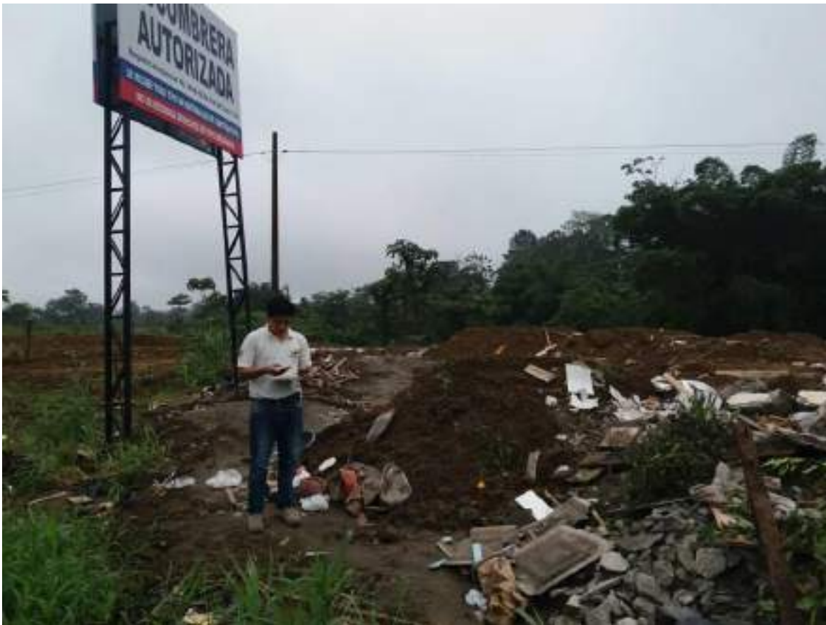
Fotografía 1, Técnico de la Unidad de Calidad Ambiental realizando inspección en botadero de basura de Santo Domingo, en atención a denuncia por mala disposición de desechos sólidos en el lugar.