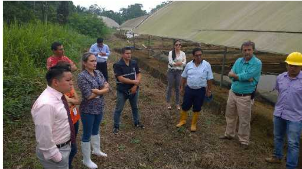
Inspección al complejo ambiental de Santo Domingo de los Tsáchilas

Caminamos hacia un licenciamiento optimizado y un riguroso control ex post